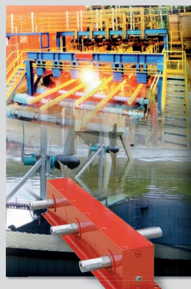
Customized Solutions by Premium Stephan