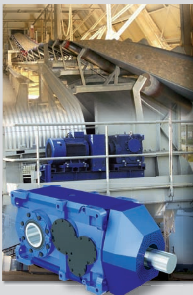
Conveyor Solutions C4-Gearmotor Series