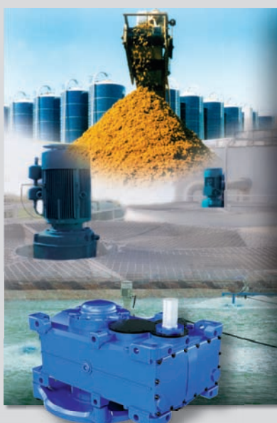
Environmental Solutions E4-Gearmotor Series