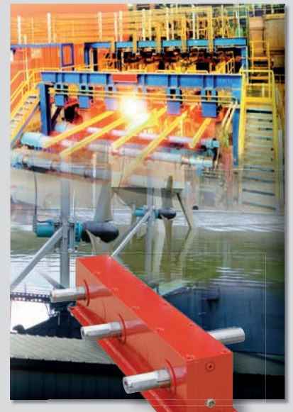
Customized Solutions by Premium Stephan