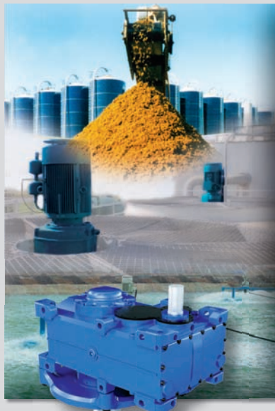
Environmental Solutions E4-Gearmotor Series